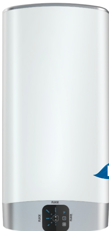
DUOS 80 LITROS