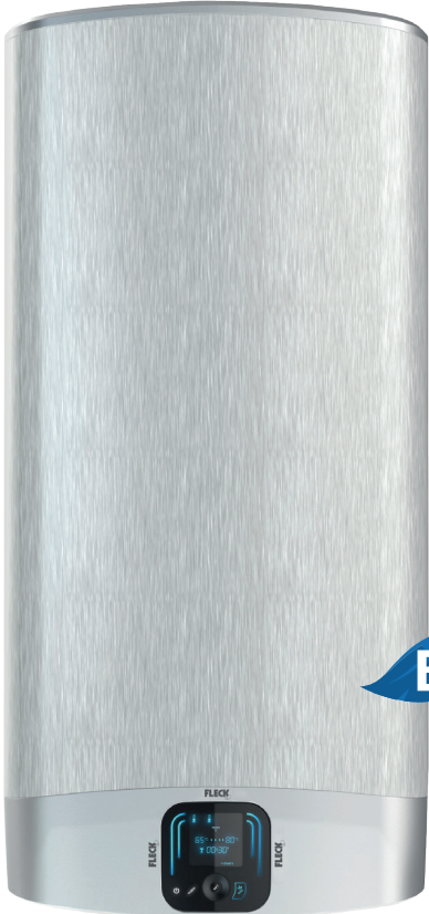
DUO7 80 LITROS