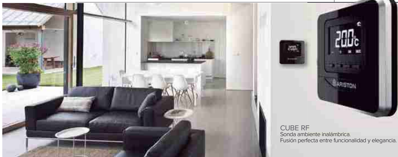
CUBE RF Sonda ambiente inalámbrica. Fusión perfecta entre funcionalidad y elegancia.